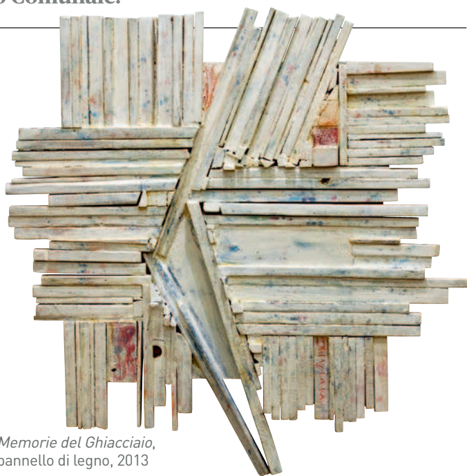
Memorie del Ghiacciaio, pannello di legno, 2013

Sostituisce la retorica del già visto, magari articolato in modo complesso, con la tensione creativa della ricerca sui numeri primi. Il suo linguaggio è apparentemente schematico e ricorda l'astrazione antica. Allora il contenuto è il motivo dello smarrimento, perché rivela l'anima, lo spirito della persona. Ecco che quello che poteva essere muta rappresentazione, mimesi, da segno diventa simbolo. In questo modo non è più espressione individuale, protesi per l'ego