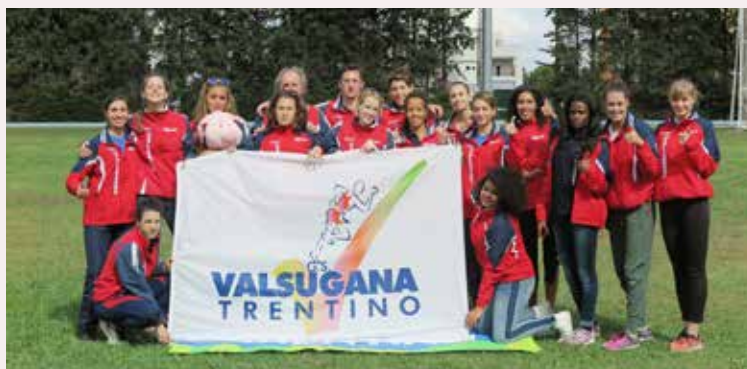
La gioia del Gs Valsugana dopo la vittoria nella Finale Argento di Matera