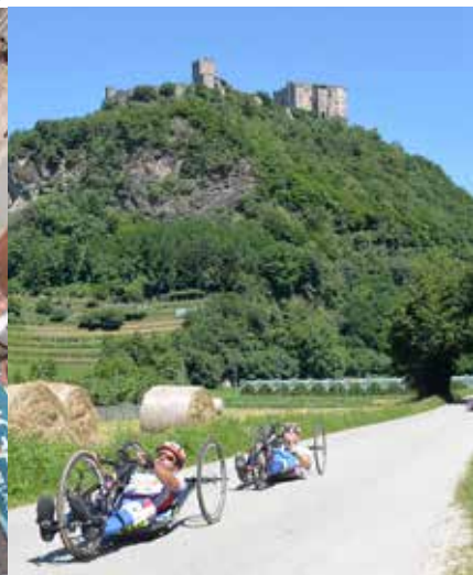
Campionati italiani di ciclismo paralimpico a Pergine Valsugana